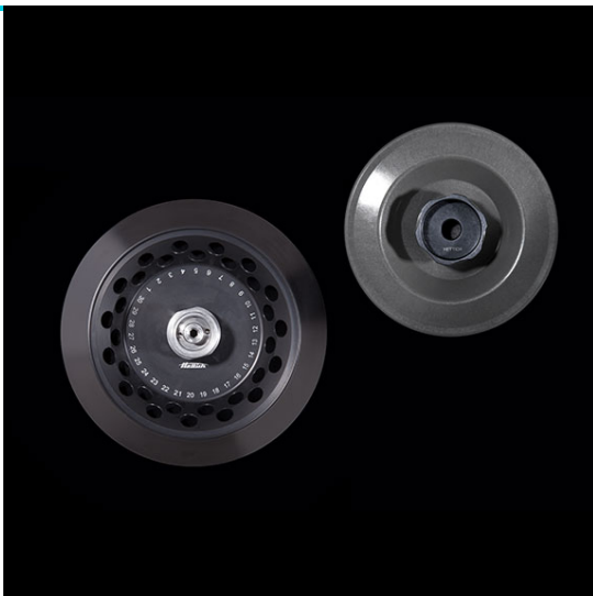
Арт. 2437. 30-местный угловой ротор