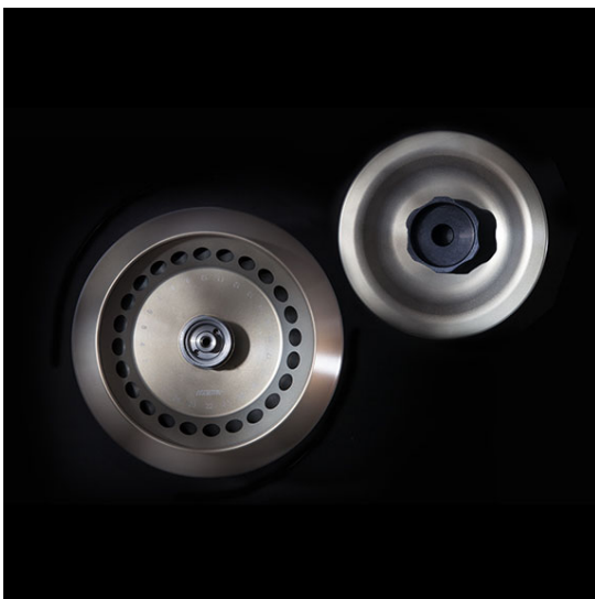
Арт. 2428. 24-местный угловой ротор