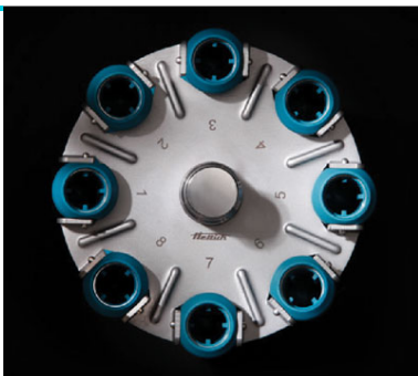
Арт. 1148. 8-местный горизонтальный ротор