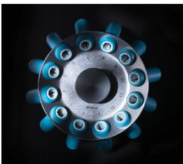
Арт. 1133. 12-местный угловой ротор