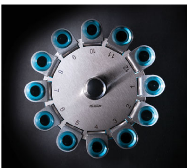
Арт. 1142. 12-местный горизонтальный ротор